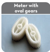
Meter with oval gears