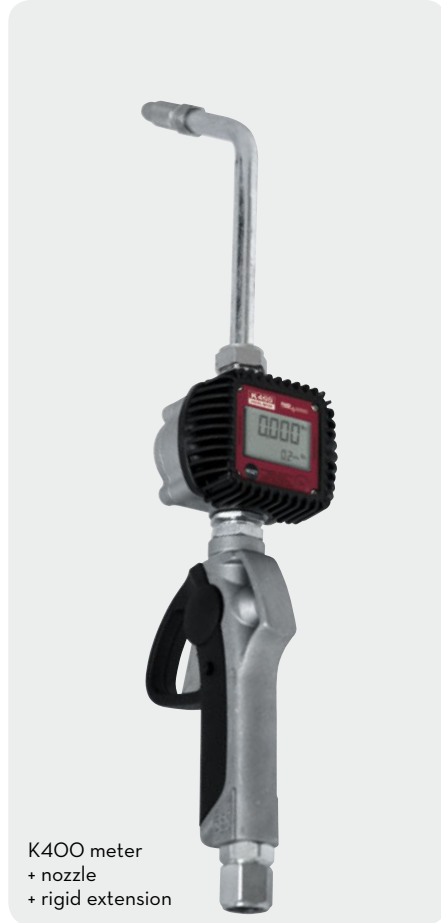
K400 meter + nozzle + rigid extension