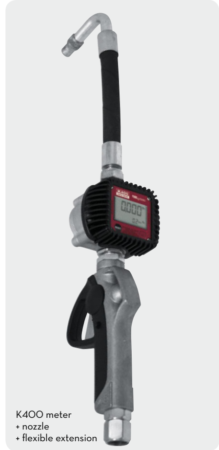
K400 meter + nozzle + flexible extension