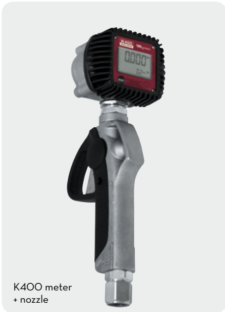
K400 meter + nozzle